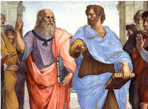
Platón y Aristóteles uno apuntando a lo ideal y el otro al mundo concreto.

La ética es la reflexión individual sobre lo que consideramos bueno o malo. Dice Aristóteles que todos buscamos algo al realizar cualquier tipo de acción o decisión, pero ¿Qué es? ¿Cuál es el fin último que busca el ser humano cuando estudia, trabaja o pasa tiempo de ocio? Si uno se cuestiona los motivos por los que realiza una cierta acción, dice Aristóteles, llegará al motivo último o definitivo que mueve todos nuestros actos voluntarios: la búsqueda de la felicidad.